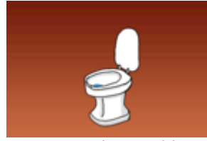
Eine Toilette; Bild: Internet-ABC

Zeigen Sie die Auflösung: Das 3. Bild in der Galerie handelt sich um eine Fotomontage!