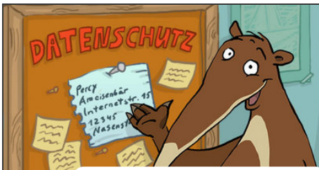
Percy an einer Datenschutz-Pinnwand; Bild: Internet-ABC