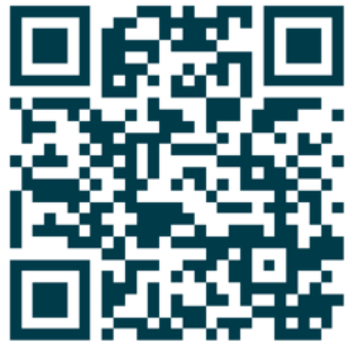
Lernmodul "2.2. Chatten und Texten – WhatsApp und mehr"; Internet-ABC