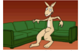
Jumpy sitzt auf dem Sofa