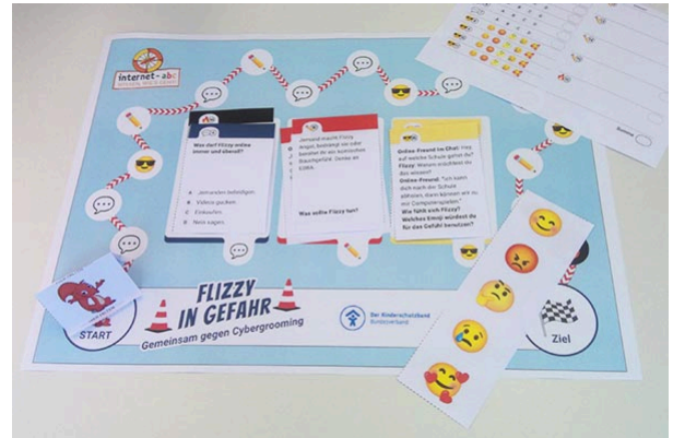
Materialien des Abschlustrainings "Flizzy in Gefahr"

Bitte drucken Sie diese Materialien, falls möglich, farbig aus.