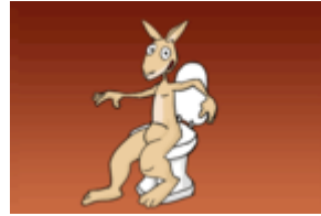
Jumpy sitzt auf einer Toilette