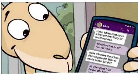
Jumpy liest Chatnachrichten auf seinem Handy