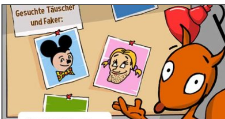
Aber du durchschl... Flizzy warnt vor falschen Personen im Internet