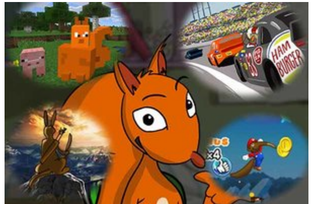
Flizzy vor verschiedenen Filmen

Cybergrooming ist eine Gefahr für Kinder im Internet. Wie können Lehrkräfte das Thema Cybergrooming im Unterricht behandeln? Lehrkräfte können helfen, Kinder vor sexualisierter Gewalt zu schützen. Im Folgenden wird ein spielerischer Ansatz mit einer Rahmengeschichte vorgestellt, den das Internet-ABC entwickelt hat, um die Kinder in insgesamt 7 Unterrichtsstunden zu begleiten und zu stärken.