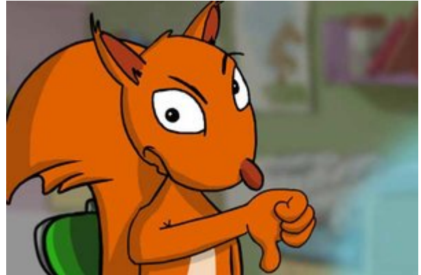
Flizzy zeigt mit dem Daumen nach unten; Bild: Internet ABC

Lesen Sie der Klasse Flizzys Rahmenerzählung "Kamera an?" vor: