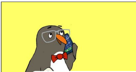
Eddie ruft bei einer Hilfestelle an