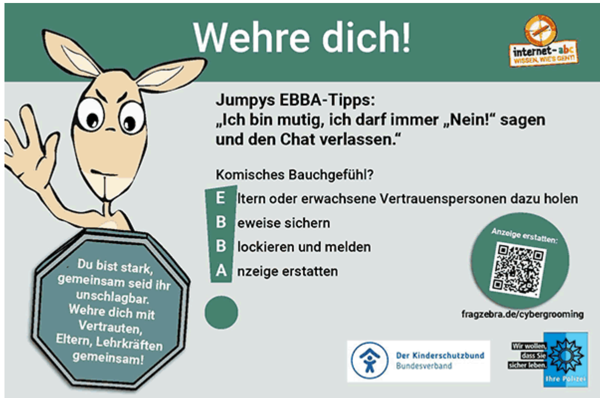
Poster "Wehre dich!"

Das Poster gibt Tipps, wie sich die Schülerinnen und Schüler im Internet schützen können. Besprechen Sie die Tipps gemeinsam und ermutigen Sie die Kinder, ihre eigenen Strategien zu teilen.