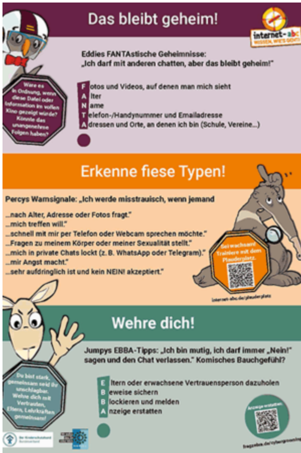
Poster mit allen Schutzregeln